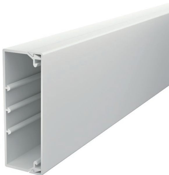
Kanaloverdel og -underdel med bundperforering.